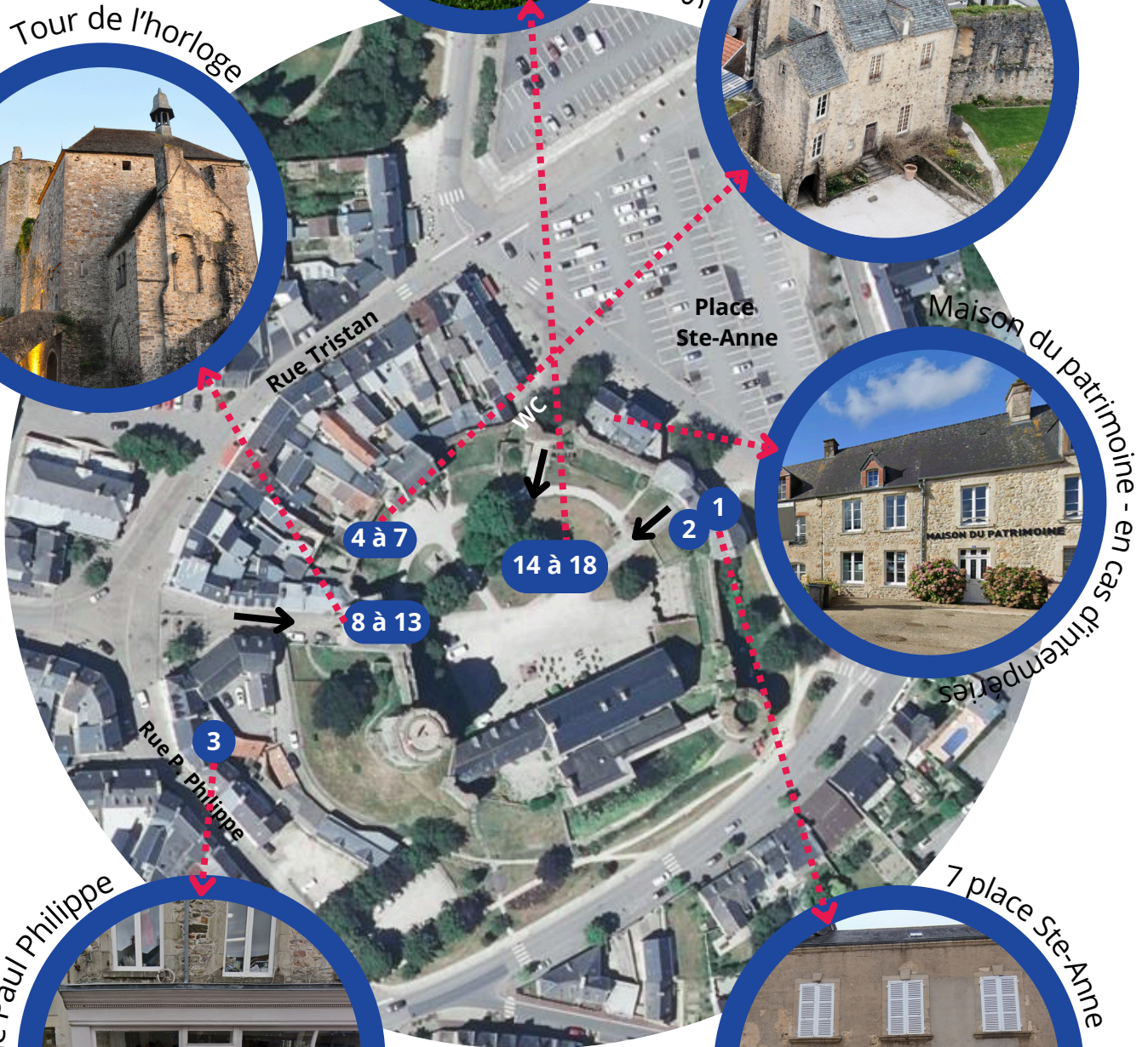
Maison du patrimoine - en cas d'intempéries