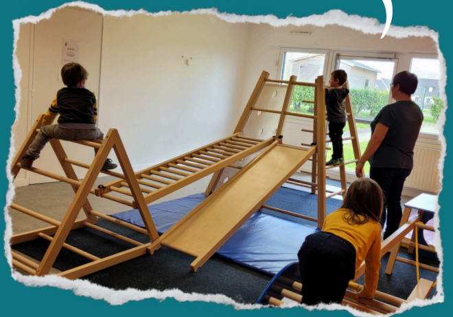
Salle de motricité