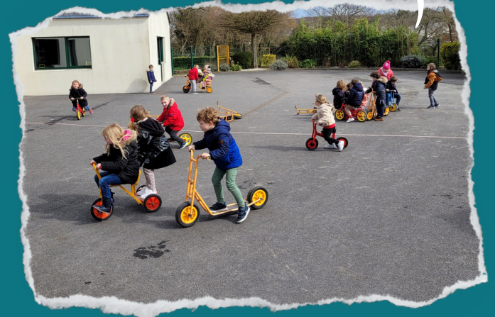
Parc à vélos