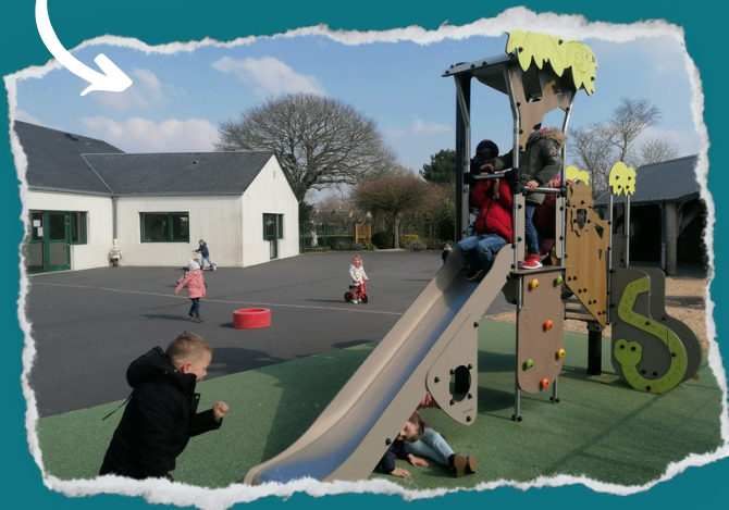
Structure de motricité