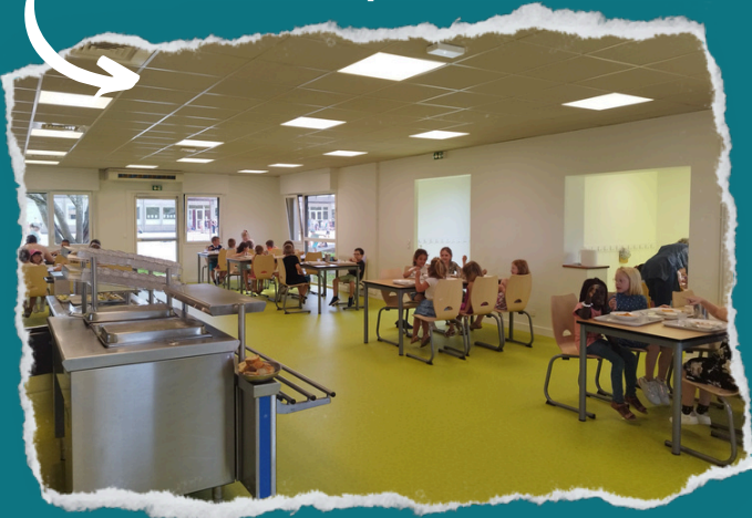
Restaurant scolaire de Bricquebec