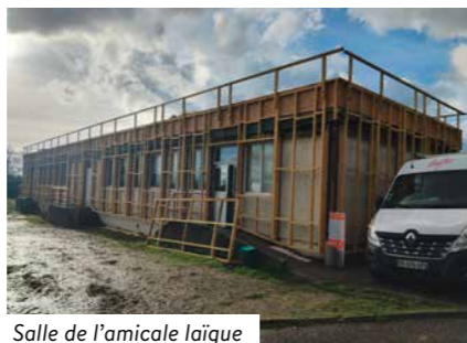
Salle de l'amicale laïque