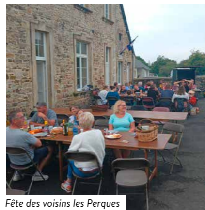
Fête des voisins les Perques

Esprit de voisinage à l'honneur : la fête des voisins rassemble les habitants des Perques pour un moment convivial et chaleureux, symbole de solidarité et de partage.