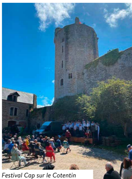
Festival Cap sur le Cotentin

Cap sur le Cotentin : le festival bat son plein à Bricquebec-en-Cotentin, avec des spectacles et animations qui célèbrent la culture locale et son artisanat