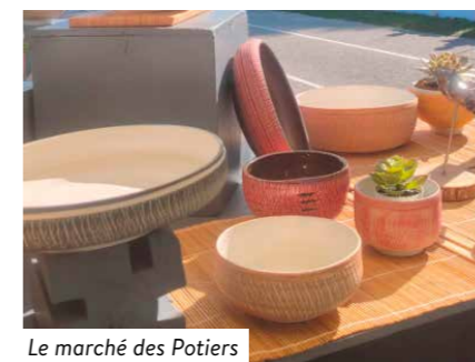
Le marché des Potiers

Le marché des Potiers a rassemblé près de 6600 visiteurs en cette année particulière. 10 ans déjà que cet événement incontournable réunit artisans et passionnés de céramique locaux au cœur du Cotentin.