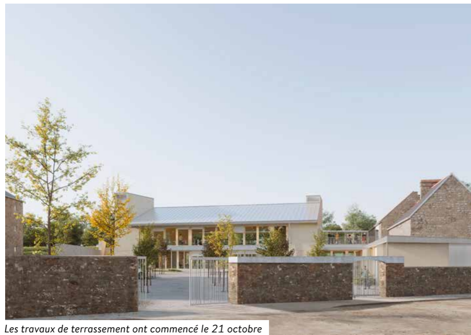
Les travaux de terrassement ont commencé le 21 octobre