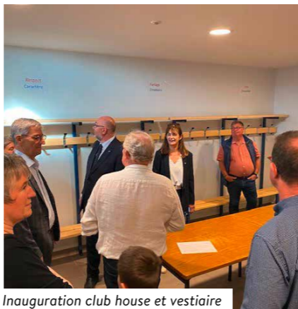
Inauguration club house et vestiaire

Le nouveau club house, conçu pour être un véritable lieu de vie pour les sportifs et les supporters, offre des espaces confortables pour se retrouver, échanger et se préparer avant ou après les matchs. Les vestiaires, quant à eux, répondent aux normes les plus récentes en matière de sécurité et de confort, garantissant ainsi une meilleure expérience pour les équipes.