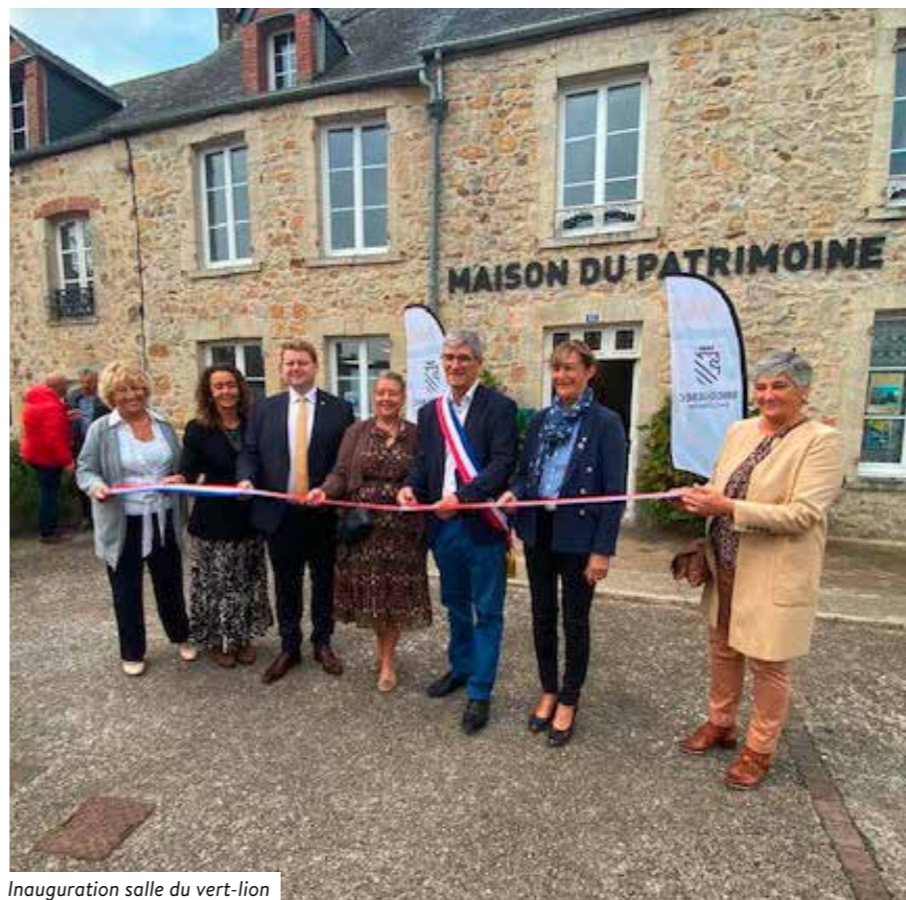
Inauguration salle du vert-lion

La salle du vert-lion a été inaugurée le jour de l'entrée de Bricquebec-en-Cotentin dans le réseau Petites Cités de Caractère. Seule ville homologuée dans le département de la Manche, ce fût un moment fort de la Cité. Faire partie de ce réseau est une reconnaissance de notre patrimoine et des efforts de la municipalité pour maintenir l'authenticité de la ville. C'est aussi une opportunité de renforcer notre tourisme et de faire découvrir nos richesses à un public plus large.