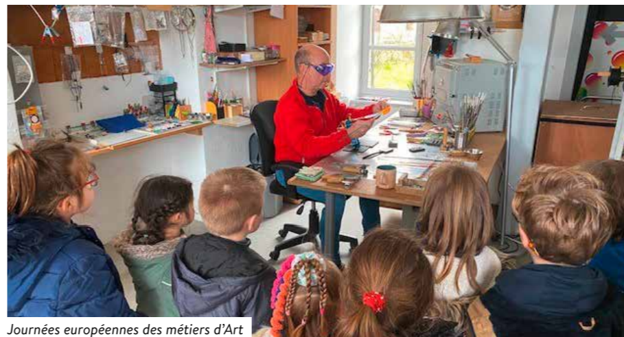
Journées européennes des métiers d'Art