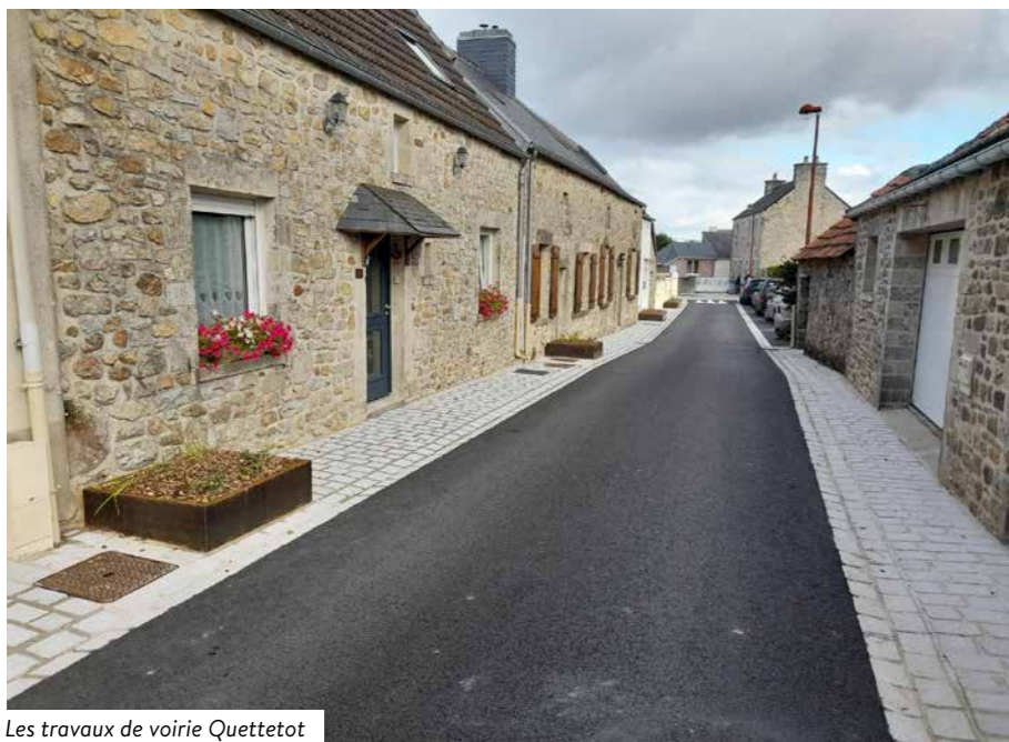
Les travaux de voirie Quettot

Cette année a été riche en projets et en réalisations à Bricquebec-en-Cotentin. Dans ce numéro, nous vous invitons à découvrir les différentes inaugurations passées, qui témoignent de l'engagement de la municipalité à améliorer le cadre de vie de ses habitants par le respect de ses projets de mandat. De nouvelles infrastructures aux rénovations d'espaces publics, chaque projet vise à renforcer notre dynamisme local et à favoriser le bien-être de tous.