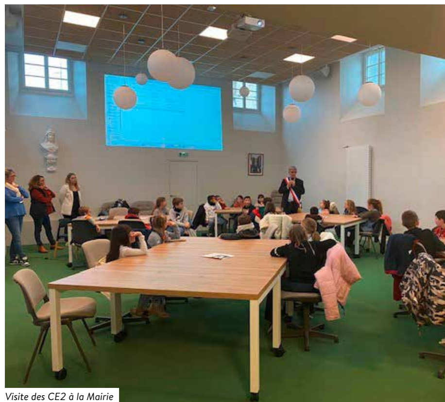
Visite des CE2 à la Mairie