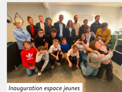
Inauguration espace jeunes

Cet Espace Jeunes représente une réponse aux attentes des jeunes de Bricquebec-en-Cotentin, tout en créant un lien fort entre eux. Il a pour vocation de devenir un lieu central d'échanges, d'initiatives et d'activités pour tous les jeunes de 11 à 17 ans. Nous encourageons tous les jeunes à s'approprier cet espace, à participer aux activités proposées et à faire de l'Espace Jeunes un lieu dynamique et convivial, 5a rue de Bricqueville.