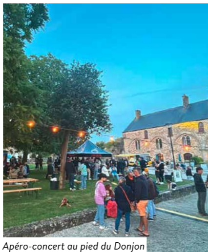
Apéro-concert au pied du Donjon

Ambiance festive au pied du Donjon : l'apéro-concert rassemble les habitants de Bricquebec-en-Cotentin pour une soirée musicale sous les étoiles, dans un cadre historique unique.