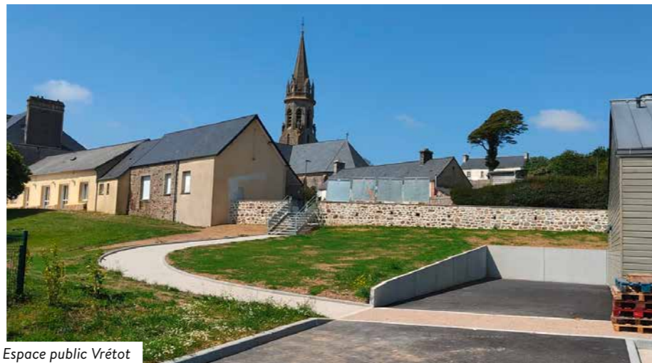
Espace public Vrétot

Cette inauguration marque le début d'une nouvelle ère pour le Vrétot, un espace qui, à n'en pas douter, sera au cœur des activités de la ville.