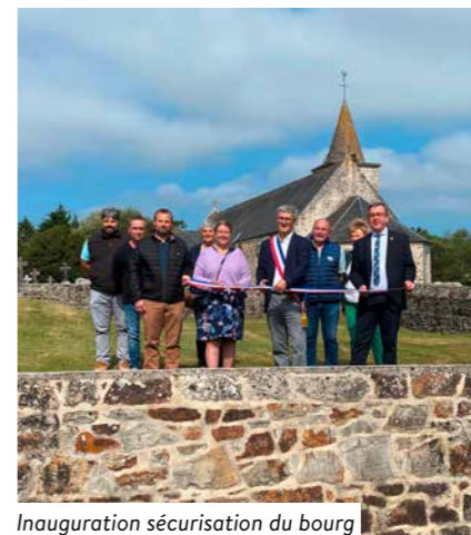
Inauguration sécurisation du bourg

Le bourg du Valdecie a accueilli avec fierté l'inauguration de ses travaux de réfection et de sécurisation, un projet qui vise à améliorer la qualité de vie des habitants et à renforcer la sécurité des usagers. Un espace revitalisé qui reflète l'engagement de la municipalité pour le développement de ses communes déléguées.