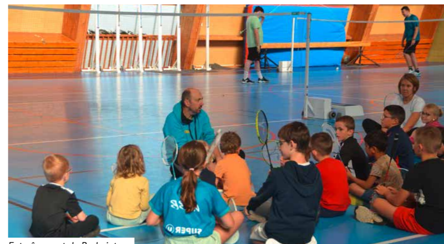
Entraînement de Badminton

Dans notre ville, le badminton et la boxe connaissent un véritable essor, attirant de plus en plus d'adhérents passionnés. Que ce soit sur les courts de badminton ou sur le ring, ces disciplines offrent à chacun la possibilité de se dépenser, de se dépasser et de partager des moments de convivialité. Découvrez l'activité de nos clubs locaux et rejoignez cette dynamique sportive !