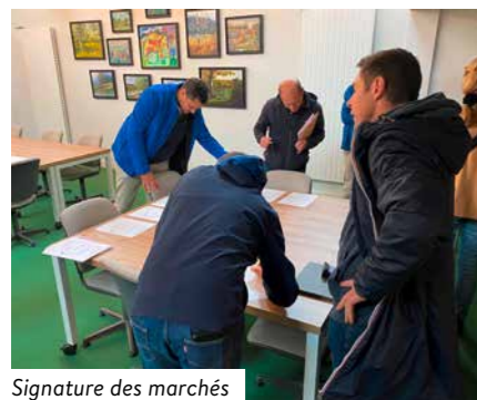
Signature des marchés

► La signature de l'ensemble des marchés a permis le lancement des travaux du Pôle de services depuis mi-octobre.