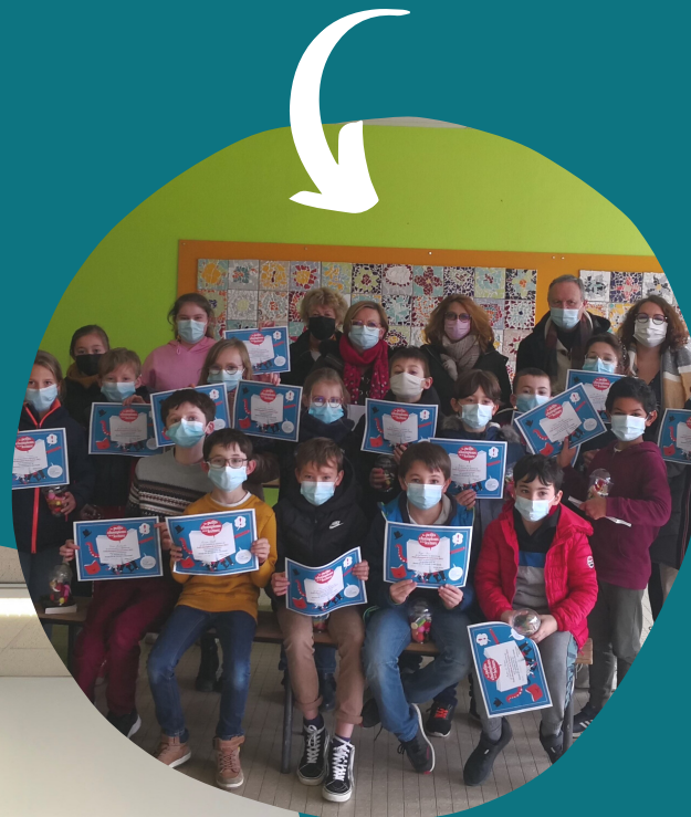
"PETITS CHAMPIONS DE LA LECTURE"